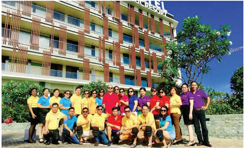
Hội nghị Bàn tròn Triệu đô 2017 là dịp để vinh danh 27 thành viên xuất sắc vừa đạt danh hiệu MDRT trước hạn của năm 2018.

Trong suốt thời gian diễn ra chương trình, các MDRT đã có cơ hội tham dự buổi tiệc chiêu đãi long trọng của Tổng Giám đốc, đồng thời gặp gỡ Ban Giám đốc, Ban Điều hành và Phát