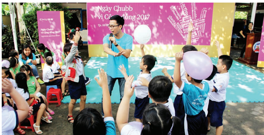
Tại sự kiện, các tình nguyện viên của tập đoàn Chubb tại Việt Nam đã tham gia nhiều hoạt động ngoại khóa lý thú và bổ ích cùng các em học sinh.