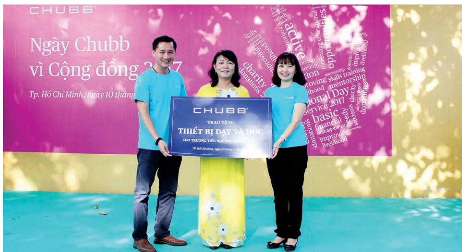
Đại diện tập đoàn Chubb tại Việt Nam trao tặng thiết bị dạy và học cho nhà trường.

Hãy cùng điểm qua một số hình ảnh rất ý nghĩa của chương trình!