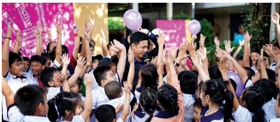
“Ngày Chubb vì Cộng đồng 2017” đã diễn ra đầy ý nghĩa với buổi huấn luyện kỹ năng mềm cho các em học sinh.