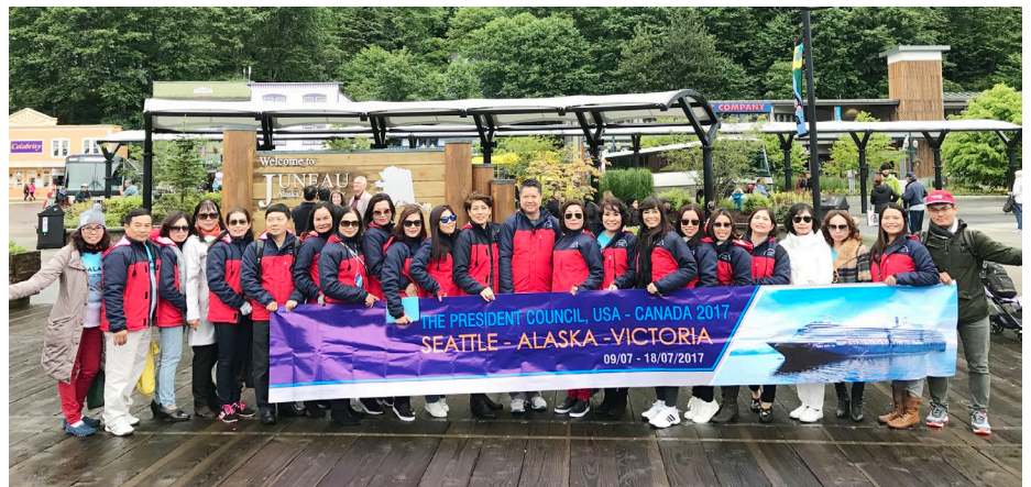
Những đại diện ưu tú của đội ngũ kinh doanh Chubb Life Việt Nam đã có nhiều trải nghiệm vô cùng thú vị trong suốt chuyến đi.

Để được tham dự chương trình này, các thành viên đã có một hành trình dài phấn đấu và nỗ lực nhằm hoàn thành xuất sắc mọi mục tiêu kinh doanh do công ty đề ra. Đây là dịp để Chubb Life Việt Nam vinh danh những thành viên ưu tú và cũng là cơ hội để các thành viên có thể tận hưởng những thành quả mà mình đã đạt được tại hai đất nước Hoa Kỳ và Canada - vốn nổi tiếng với rất nhiều cảnh đẹp. Trong suốt hành trình gần một tuần, đoàn đã có cơ hội giao lưu, chia sẻ những kinh nghiệm quý