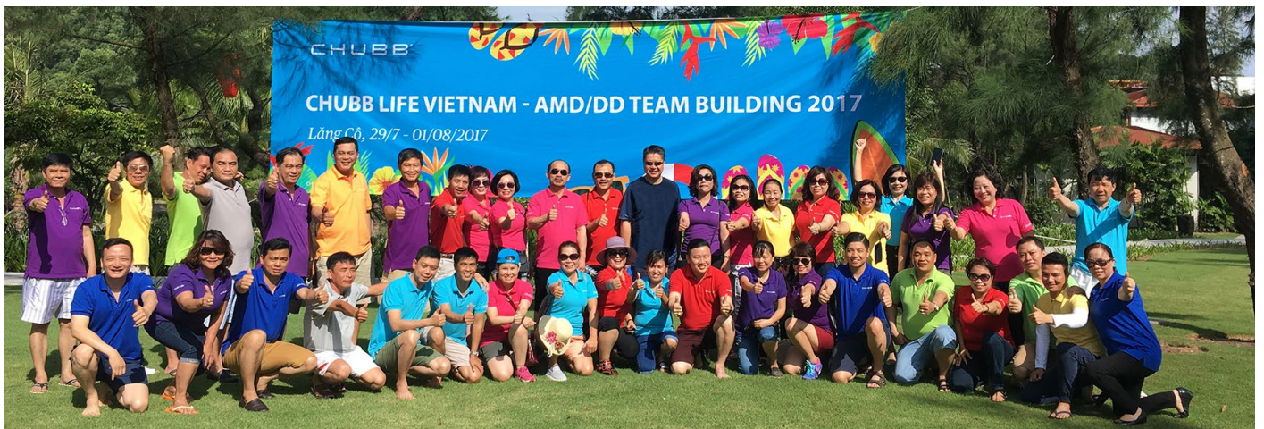
Đây cũng là cơ hội để các thành viên tham gia nhiều hoạt động đội nhóm thú vị, nâng cao tinh thần đồng đội và sự phối hợp ăn ý giữa các cá nhân.

kịp thời và sát sao hơn nữa. Bên cạnh chương trình hội nghị kinh doanh, các thành viên còn được tham gia nhiều hoạt động đội nhóm thú vị, đòi hỏi sự phối hợp nhịp nhàng, ăn ý giữa các cá nhân để đạt được thành tích tốt nhất trong công việc.