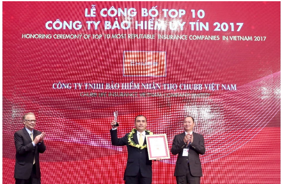
Đại diện Chubb Life Việt Nam nhận danh hiệu “Top 10 Công ty Bảo hiểm Nhân thọ Uy tín 2017”.

Để có mặt trong danh sách này, các công ty bảo hiểm phải đạt được các tiêu chí cụ thể như: (1) có năng lực và hiệu quả tài chính thể hiện trên báo cáo tài chính kiểm toán năm gần nhất; (2) có uy tín truyền thông được đánh giá bằng phương pháp Media Coding - mã hóa các bài viết về công ty bảo hiểm trên truyền thông (tính đến ngày 31/5/2017); (3) được đánh giá cao trong các điều tra khảo sát về mức độ nhận biết và sự hài lòng của khách hàng với các sản phẩm/ dịch vụ của công