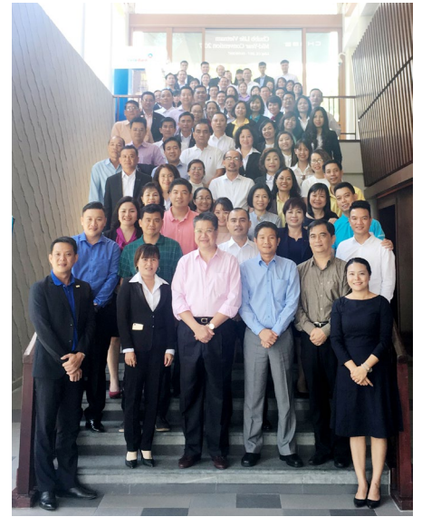
Hội nghị có sự tham dự của các thành viên Ban Giám đốc, Ban Điều hành và Phát triển Kinh doanh toàn quốc cùng các Quản lý Kinh doanh xuất sắc.

Cuối tháng 7 vừa qua, Hội nghị Sơ kết Kinh doanh giữa năm 2017 của Chubb Life Việt Nam đã diễn ra tại Lăng Cô (Thừa Thiên - Huế), với sự tham dự của các thành viên Ban Giám đốc, Ban Điều hành và Phát triển Kinh doanh toàn quốc cùng các Quản lý Kinh doanh xuất sắc. Đây là dịp để các thành viên từ khắp nơi trên toàn quốc