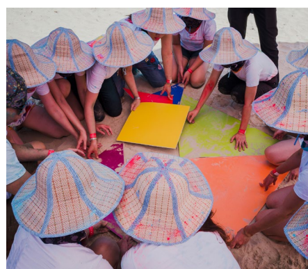
Các thành viên tham gia nhiều trò chơi vận động đội nhóm thú vị, đòi hỏi tinh thần đoàn kết và quyết tâm cao độ để vượt qua thử thách.