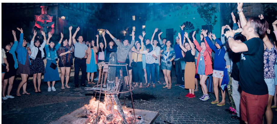
Đêm lửa trại tại Khu du lịch Bà Nà với những phút giây "cháy" hết mình của các thành viên Chubb Life Việt Nam.