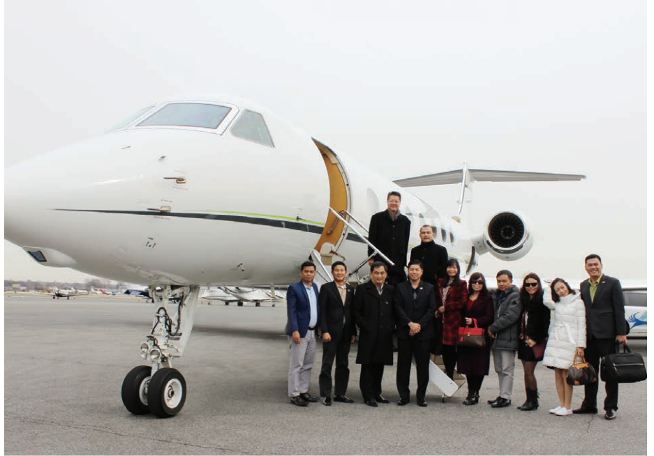
Sẵn sàng trước một chuyến đi với nhiều trải nghiệm tuyệt vời.