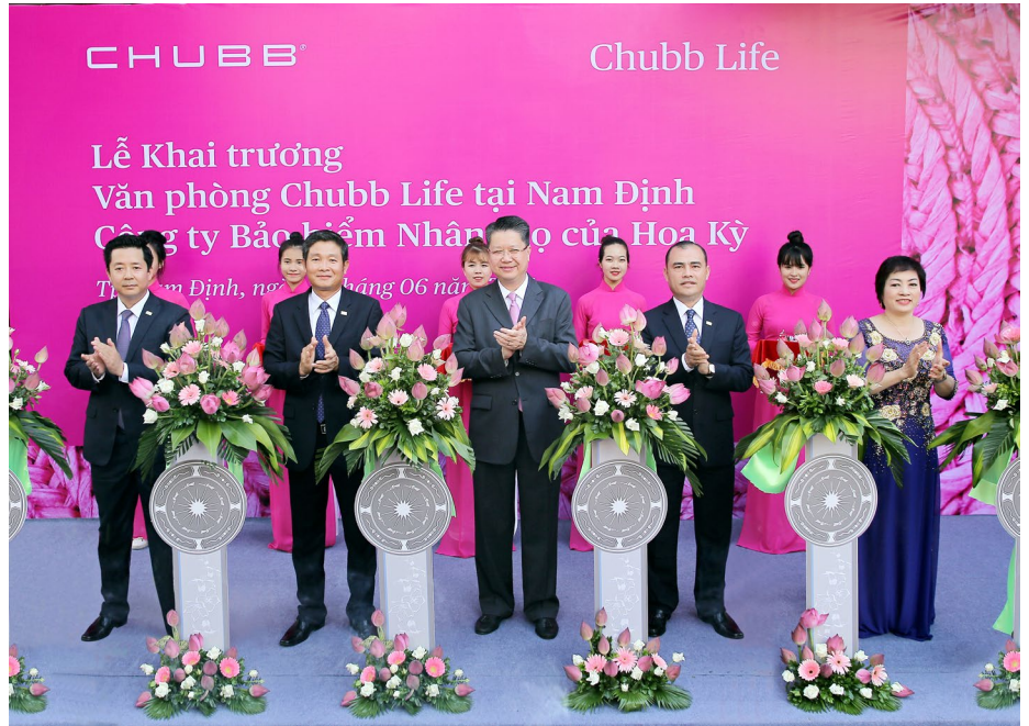
Đại diện Chubb Life Việt Nam cắt băng khai trương văn phòng Nam Định.