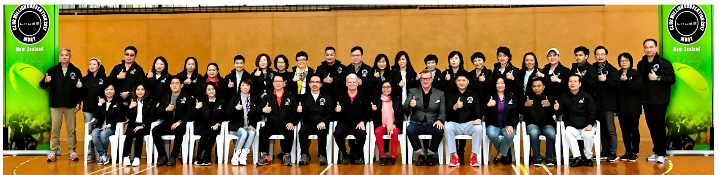
Sự kiện này là dịp để các MDRT trong khu vực có cơ hội giao lưu và cùng chia sẻ kinh nghiệm quý báu trên hành trình đi đến thành công.

MDRT (Million Dollar Round Table - Bàn Tròn Triệu Phú Đô-la) là một hiệp hội độc lập, ra đời vào năm 1927 tại Hoa Kỳ, hiện hoạt động trên toàn cầu với hơn 49.500 thành viên - là những chuyên gia hàng đầu trong lĩnh vực tư vấn dịch vụ tài chính và bảo hiểm nhân thọ (BHNT), đến từ 500 công ty tại 70 quốc gia. Danh hiệu MDRT luôn là niềm mơ ước của bất kỳ tư vấn viên nào khi gia nhập đội ngũ kinh doanh của ngành BHNT. Để trở thành thành viên của MDRT và được tổ chức này công nhận trên toàn thế giới, các tư vấn viên phải đáp ứng hàng loạt tiêu chuẩn vô cùng khắt khe, thể hiện kết quả kinh doanh vượt trội (theo chỉ tiêu của hiệp hội), kiến thức chuyên môn vững vàng, đạo đức kinh doanh chuẩn mực và dịch vụ khách hàng xuất sắc trong lĩnh vực BHNT, cũng như các dịch vụ kinh doanh tài chính.