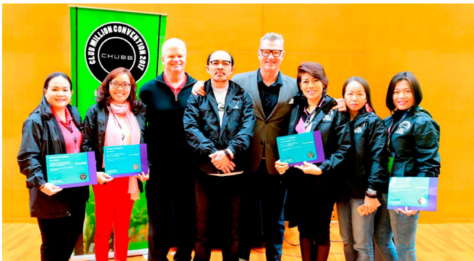
Các MDRT của Chubb Life Việt Nam nhận chứng nhận thành viên MDRT ưu tú.

Bắt đầu được chú trọng phát triển từ năm 2013 đến nay, lực lượng MDRT của Chubb Life Việt Nam luôn thể hiện sự tăng trưởng vững chắc qua từng năm, với mức tăng trưởng lần lượt là 205% (2014), 215% (2015) và 138% (2016). Chubb Life