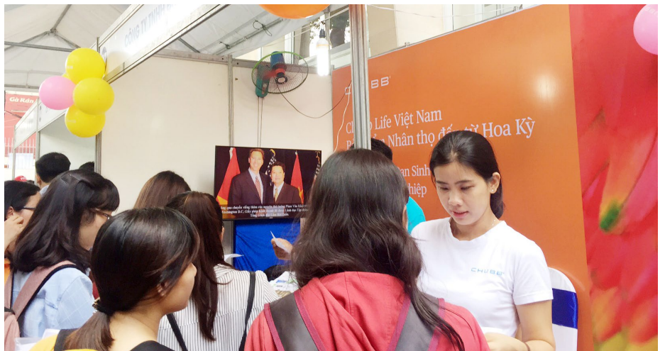
Gian hàng Chubb Life tại “Ngày hội Nghề nghiệp” đã thu hút sự quan tâm của đông đảo các bạn sinh viên.

Tham gia sự kiện lần này, Chubb Life Việt Nam mong muốn góp phần nâng cao hiệu quả hoạt động định hướng nghề nghiệp và tuyển dụng những