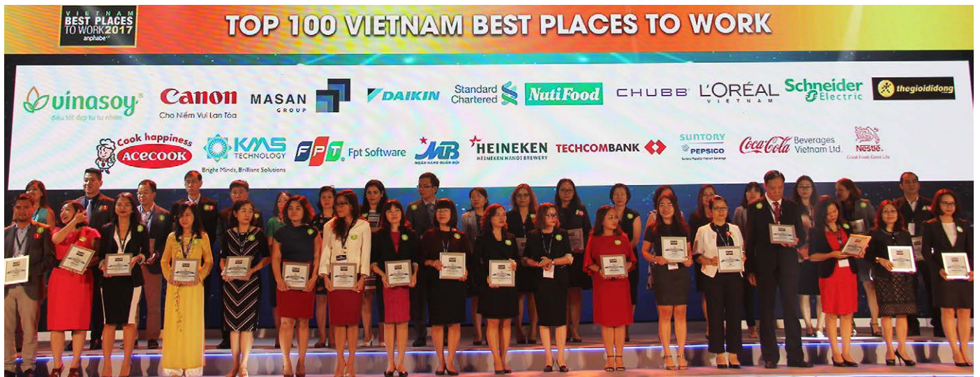
Chubb Life Việt Nam được vinh danh trong top 5 nơi làm việc tốt nhất ngành bảo hiểm.