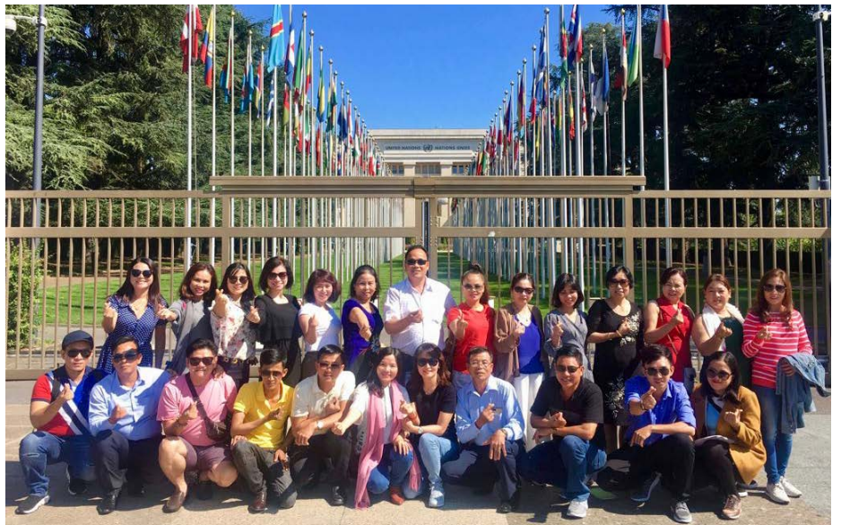
Chuyến đi đã mang đến nhiều trải nghiệm mới lạ và những kỉ niệm đẹp cho các thành viên.