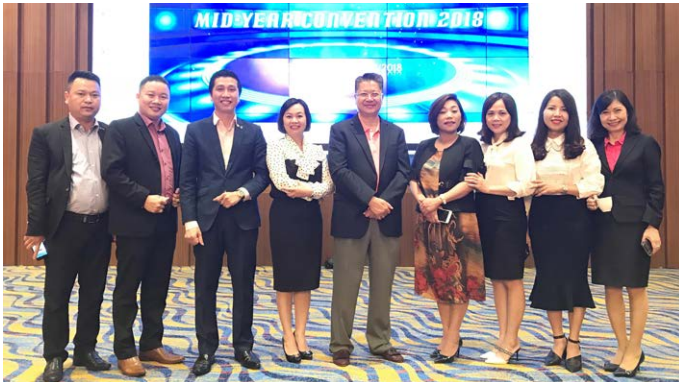
Hội nghị Kinh doanh giữa năm 2018 là cơ hội để các thành viên quản lý cấp cao Chubb Life Việt Nam cùng trao đổi và lắng nghe nguyện vọng của đội ngũ kinh doanh toàn quốc.

Bên cạnh chương trình hội nghị kinh doanh, các thành viên còn có cơ hội tham quan nhiều địa điểm du lịch nổi tiếng và thưởng thức đặc sản của vùng đất Quảng Ninh.